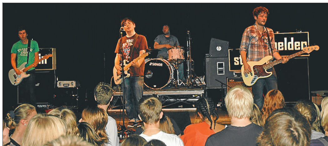
Die „Kleinstadthelden“ waren vergangenen Freitag im „Pumpwerk“ Wilhelmshaven zu Gast und begeisterten das Publikum mit tollem Alternative Rock.